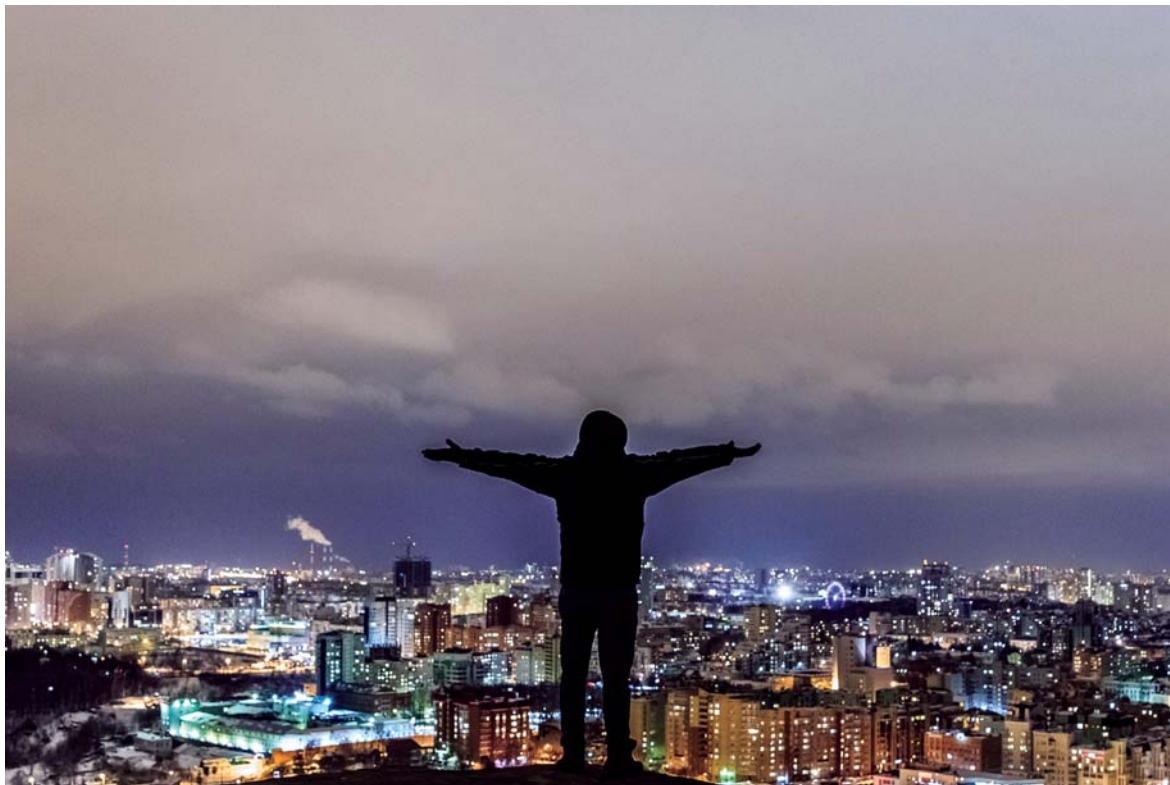
Hero shot на фоне Перми. Фото Родиона Балкова (г. Пермь)