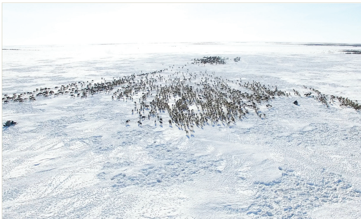
Кочевье. Ямал, 2016 г.