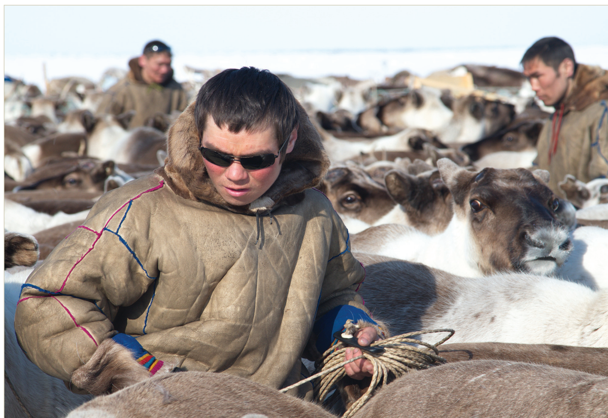
Отлов оленей. Ямал, 2016 г.