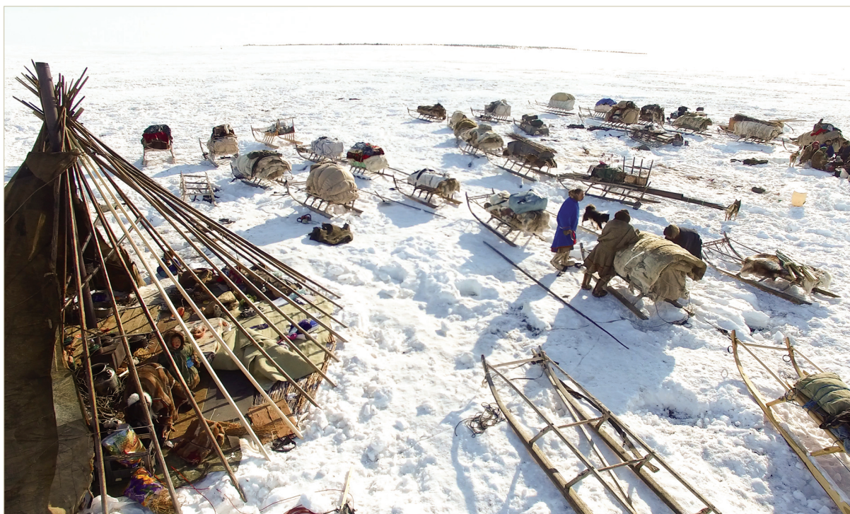
Ненецкое стойбище. Подготовка к касланию. Ямал, 2016 г.