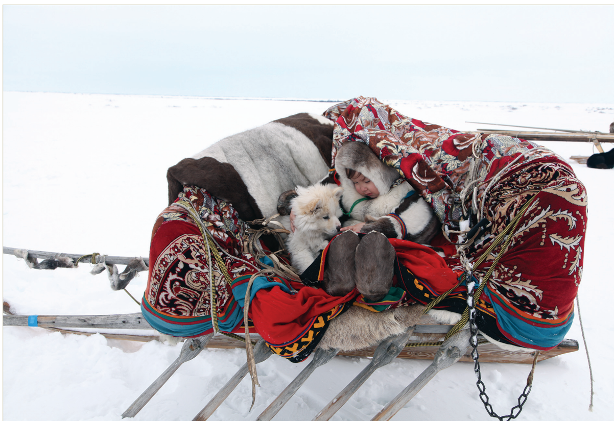
Ребенок в женской нарте. Ямал, 2016 г.