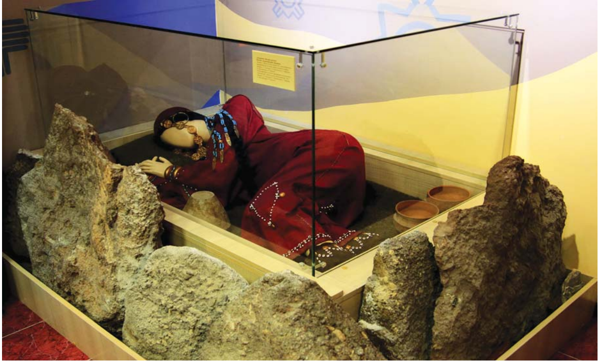
Фрагмент экспозиции: «Сакральная комната. Погребение женщины эпохи бронзы». Лисаковский музей истории и культуры Верхнего Притоболя. 2015 г.