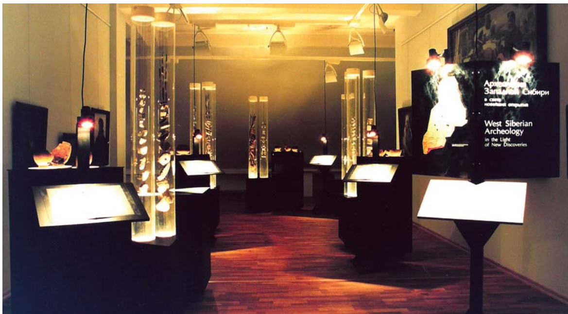
Выставка «Археология Западной Сибири в свете новейших открытий». Ханты-Мансийск, 2002 г.

К статье О. Н. Корочкиной и Э. Р. Усмановой