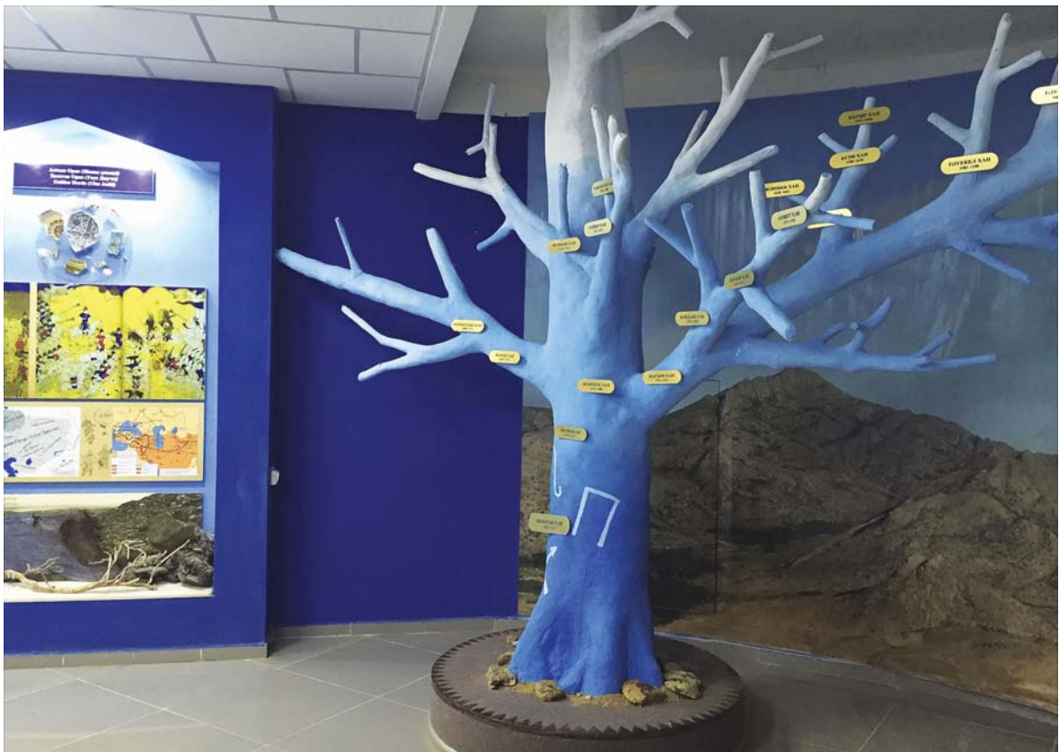
Фрагмент экспозиции: инсталляция «Ханское древо» Национальный историко-культурный и природный заповедник-музей «Улытау». 2015 г.