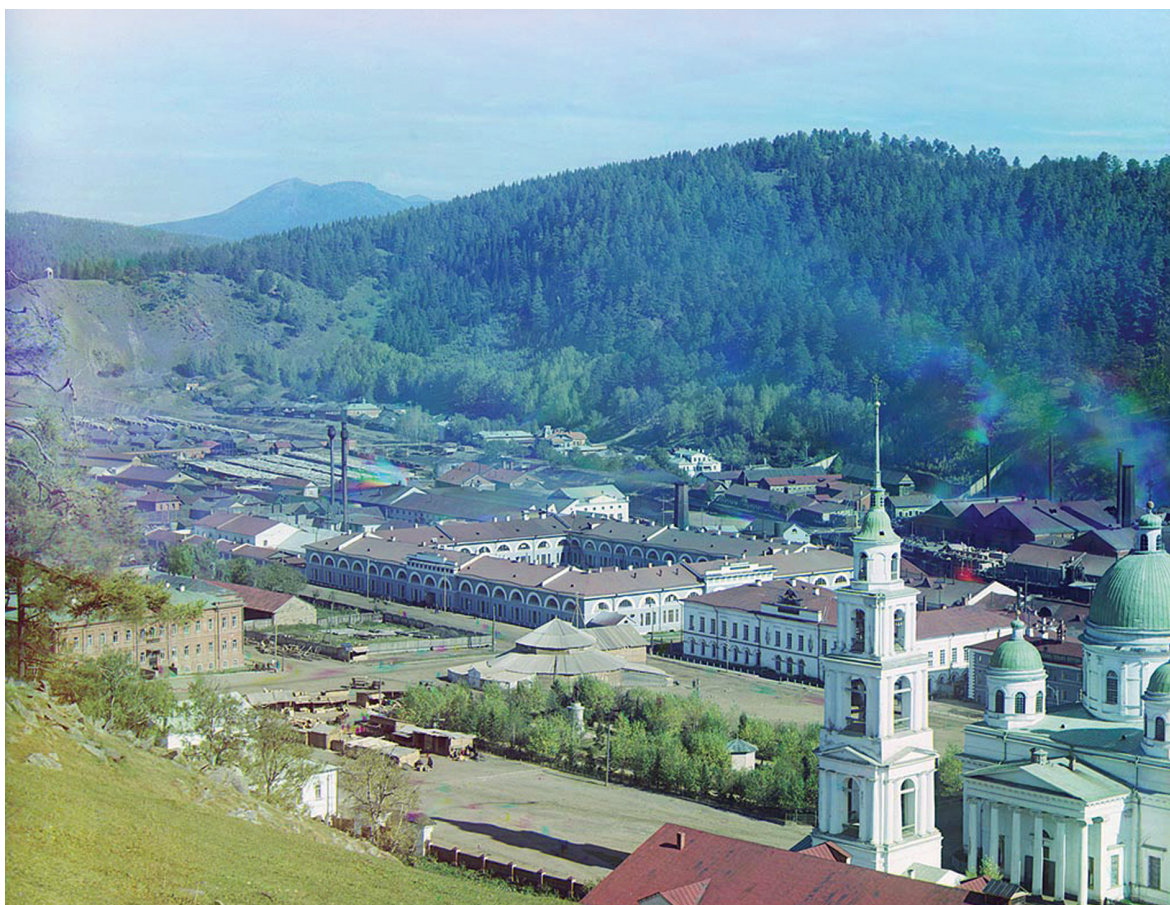
Вид на Златоустовский завод. Фото С. М. Прокудина-Горского. 1909 г.