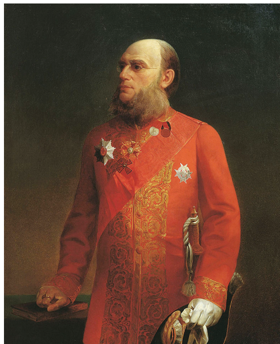
П. П. Семенов-Тян-Шанский, член Податной комиссии. Худ. А. Колесов. Холст, масло. 1874 г.