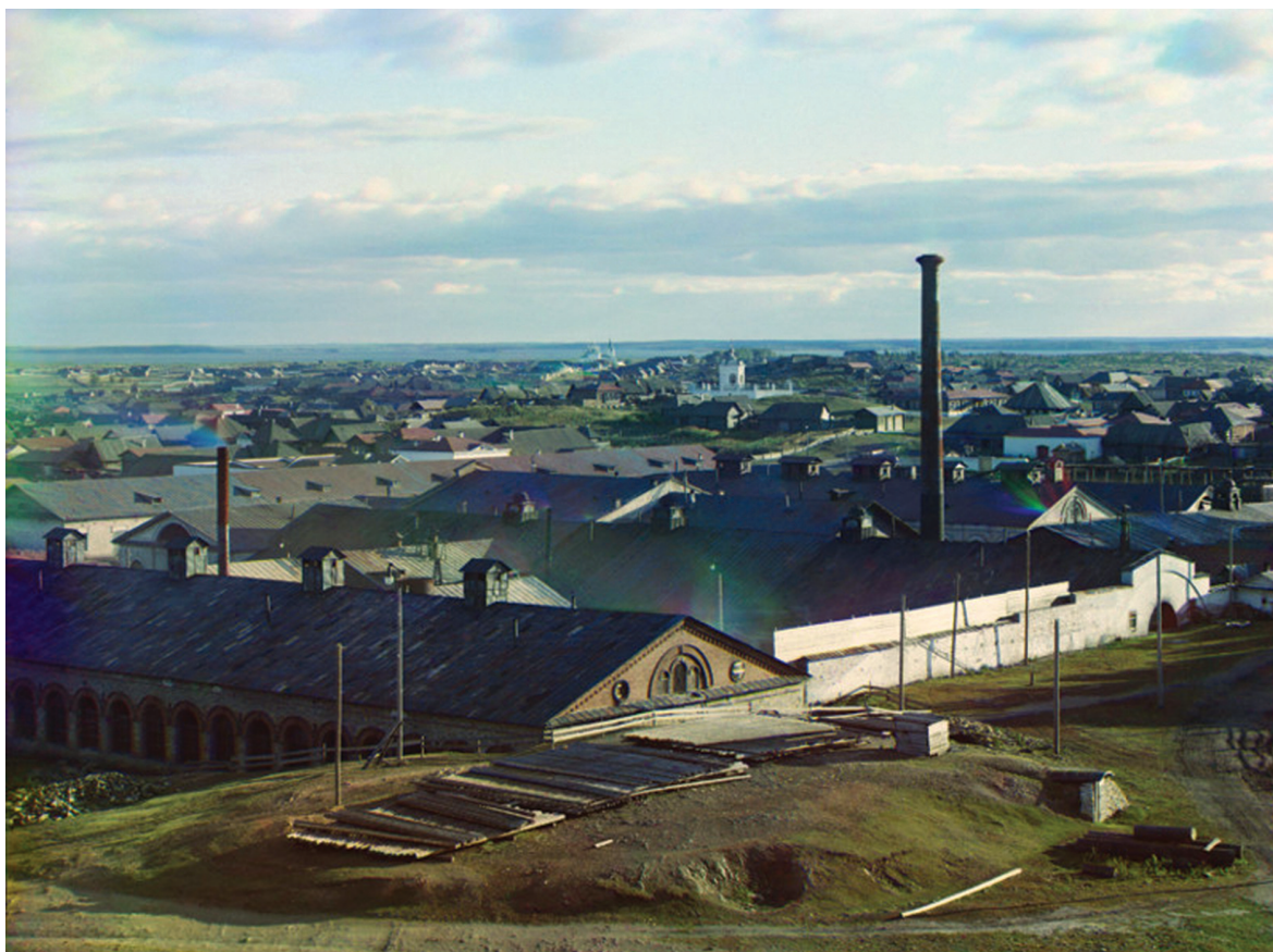
Вид на Каслинский завод. Фото С. М. Прокудина-Горского. 1909 г.