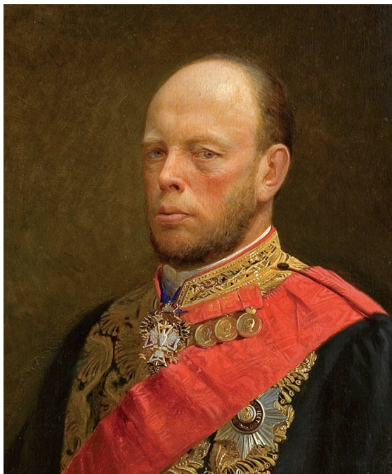
М. Х. Рейтерн, министр финансов, председатель Податной комиссии Худ. Н. Ге. Холст, масло. 1873 г.