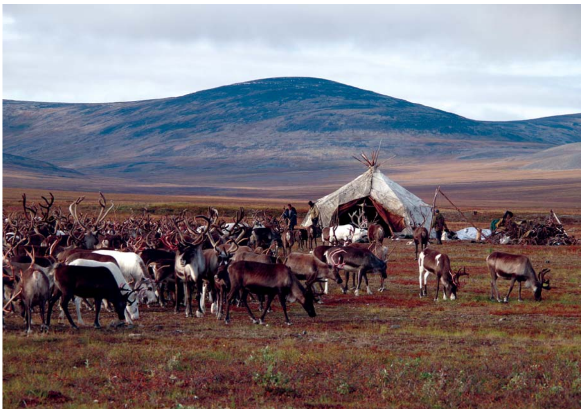
Яранга: летняя стоянка оленеводов 3-й бригады МП СПХ «Чаунское». Чаун-Чукотка. 2014 г.