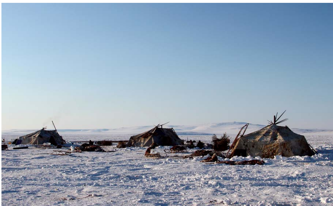
Меховая «палатка»: зимняя стоянка оленеводов 3-й бригады МП СПХ «Чаунское». Чаун-Чукотка. Фото Д. А. Куканова, 2015 г.