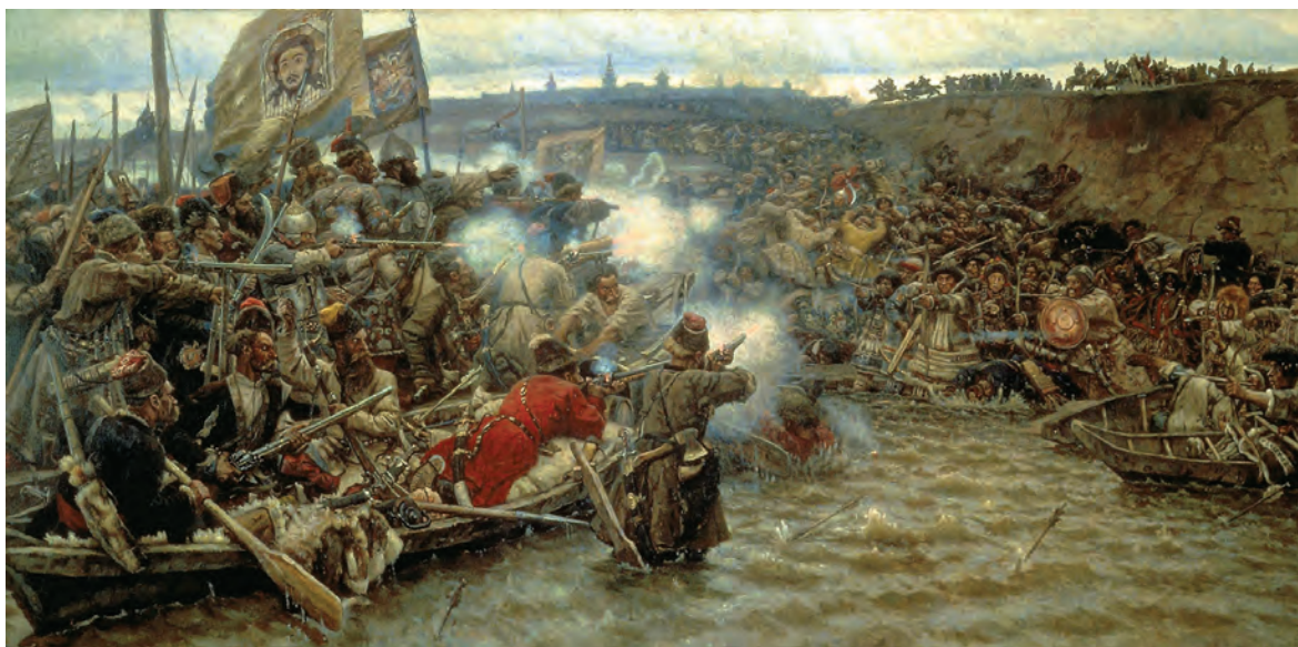
«Покорение Сибири Ермаком Тимофеевичем». Художник В. И. Суриков. 1895 г. Холст, масло. Государственный Русский музей, Санкт-Петербург