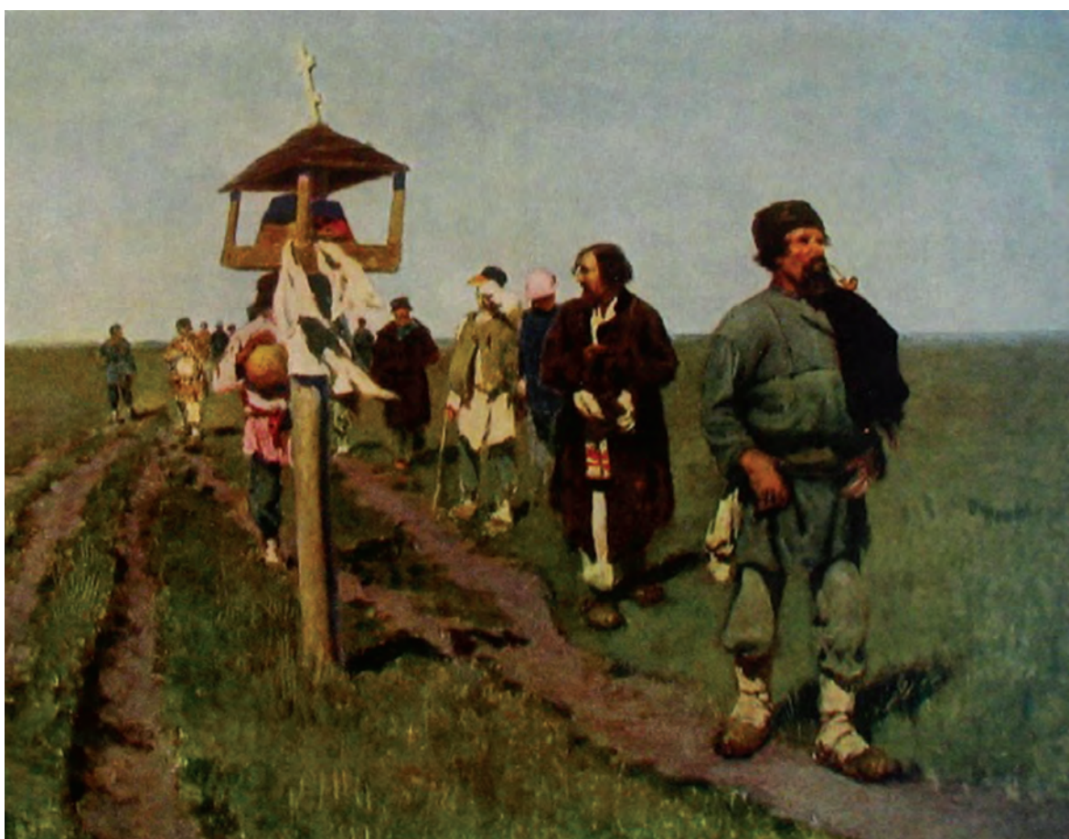
«Переселенцы. Ходоки». Художник С. В. Иванов, 1886 г. Холст, масло. Башкирский государственный художественный музей им. М. В. Нестерова