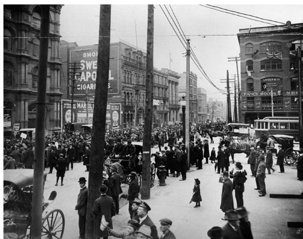
Манифестация против призыва в Монреале, 24 мая 1917 г.

Диссонирующие голоса приходят прежде всего из Квебека, чье франкоязычное население сегодня составляет около четверти граждан Канады. Жители Новой Франции, предки населения современного Квебека, были завоеваны англичанами около 250 лет назад. Они не считали себя верноподданными коро-