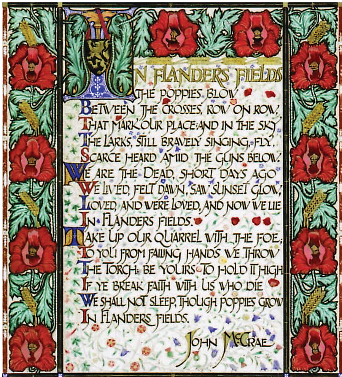
«На полях Фландрии». Каллиграфия Дж. Макдональда. Торонто, 1920 г. Zeta Psi Fraternity