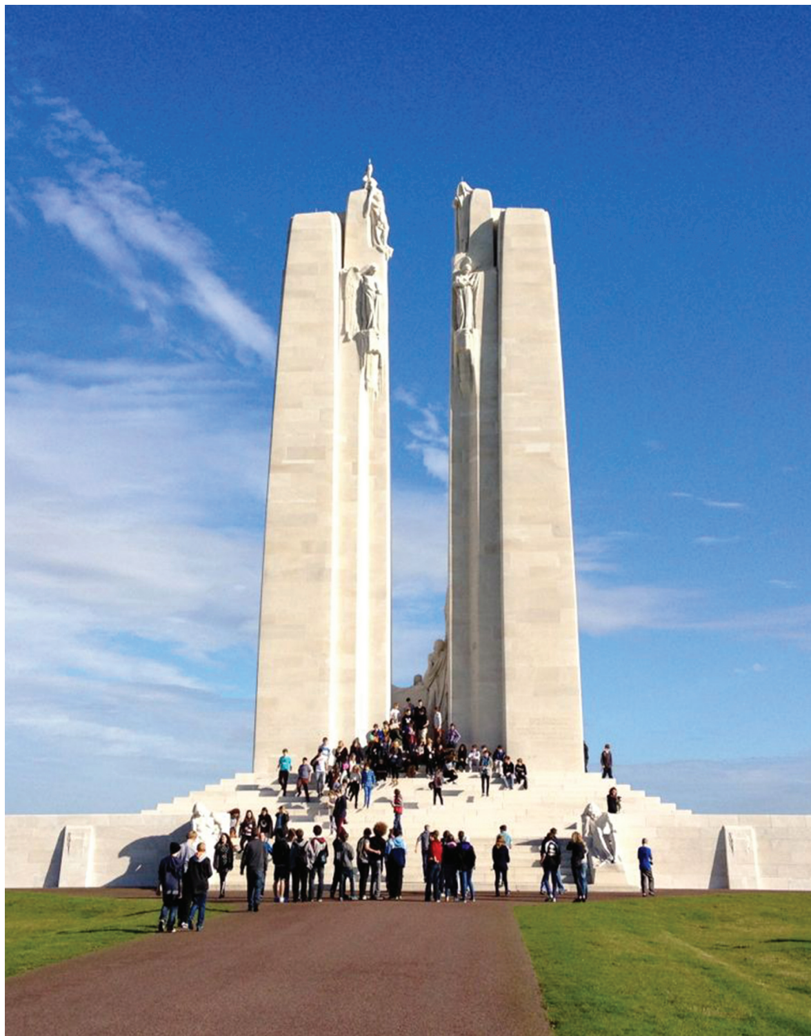
Мемориал в память о павших канадских солдатах во время битвы под Вими-Ридж в апреле 1917 г. Возведен в 1925–1936 гг. по проекту У. С. Алварда. Па-де-Кале, Франция