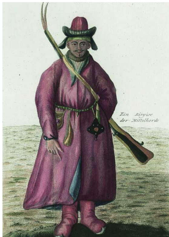
Башкирка в летнем платье. Киргиз в военном облачении. Раскрашенные гравюры