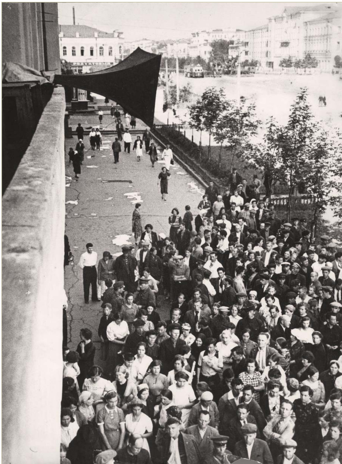
Трудящиеся Свердловска слушают выступление Наркома иностранных дел В. М. Молотова. 22 июня 1941 г.