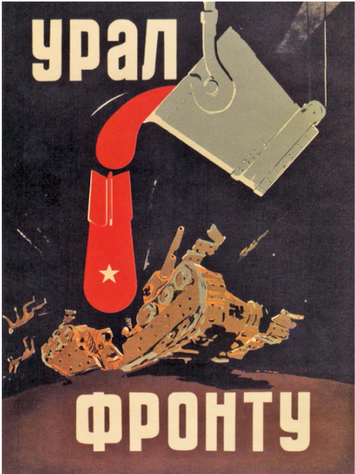
Советский политический плакат. Художник П. Я. Караченцов, 1942 г.