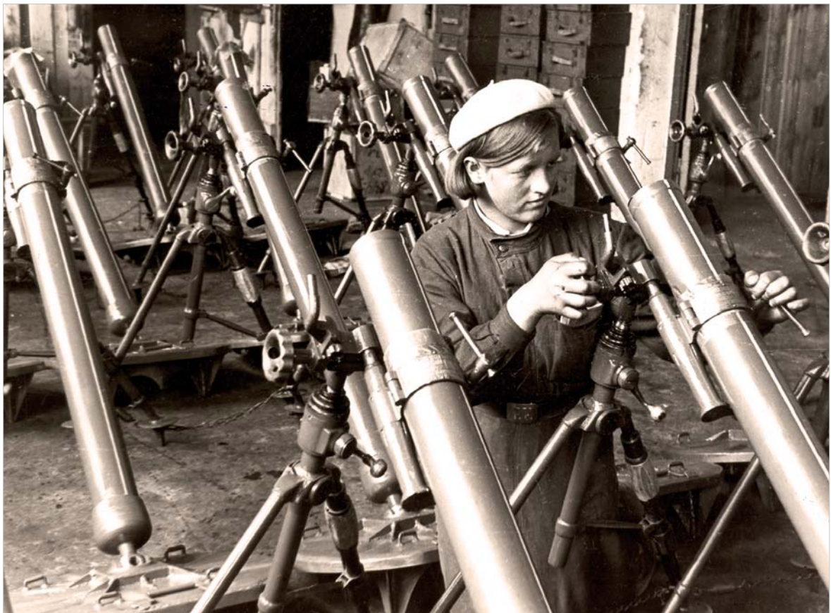
Сборка минометов на одном из оборонных заводов.