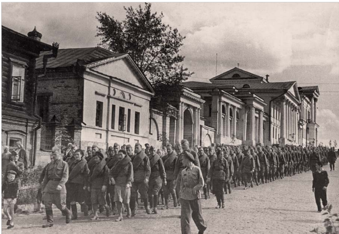
Свердловчане отправляются на фронт. Июль 1941 г.