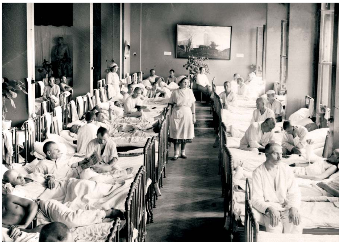
Раненые бойцы в палате эвакогоспиталя № 414. 1943 г.