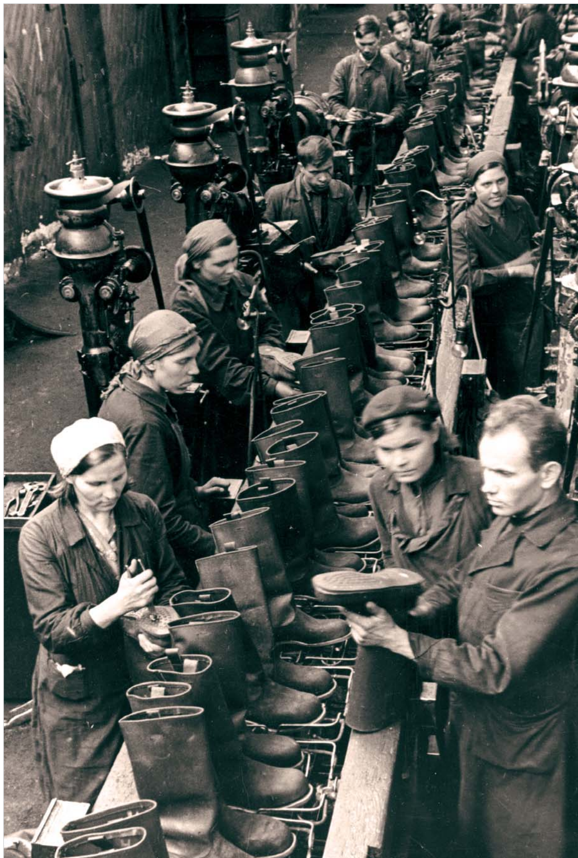
Свердловская обувная фабрика для фронта.