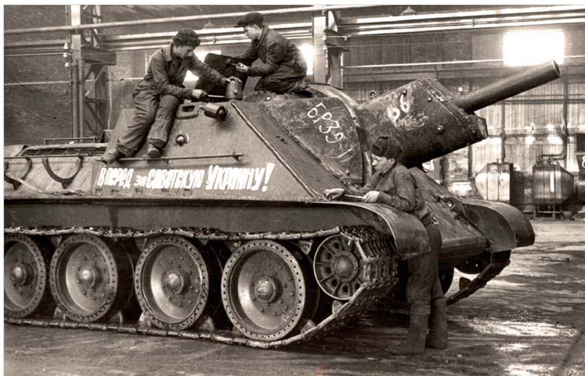
Самоходная пушка. Уралмашзавод.