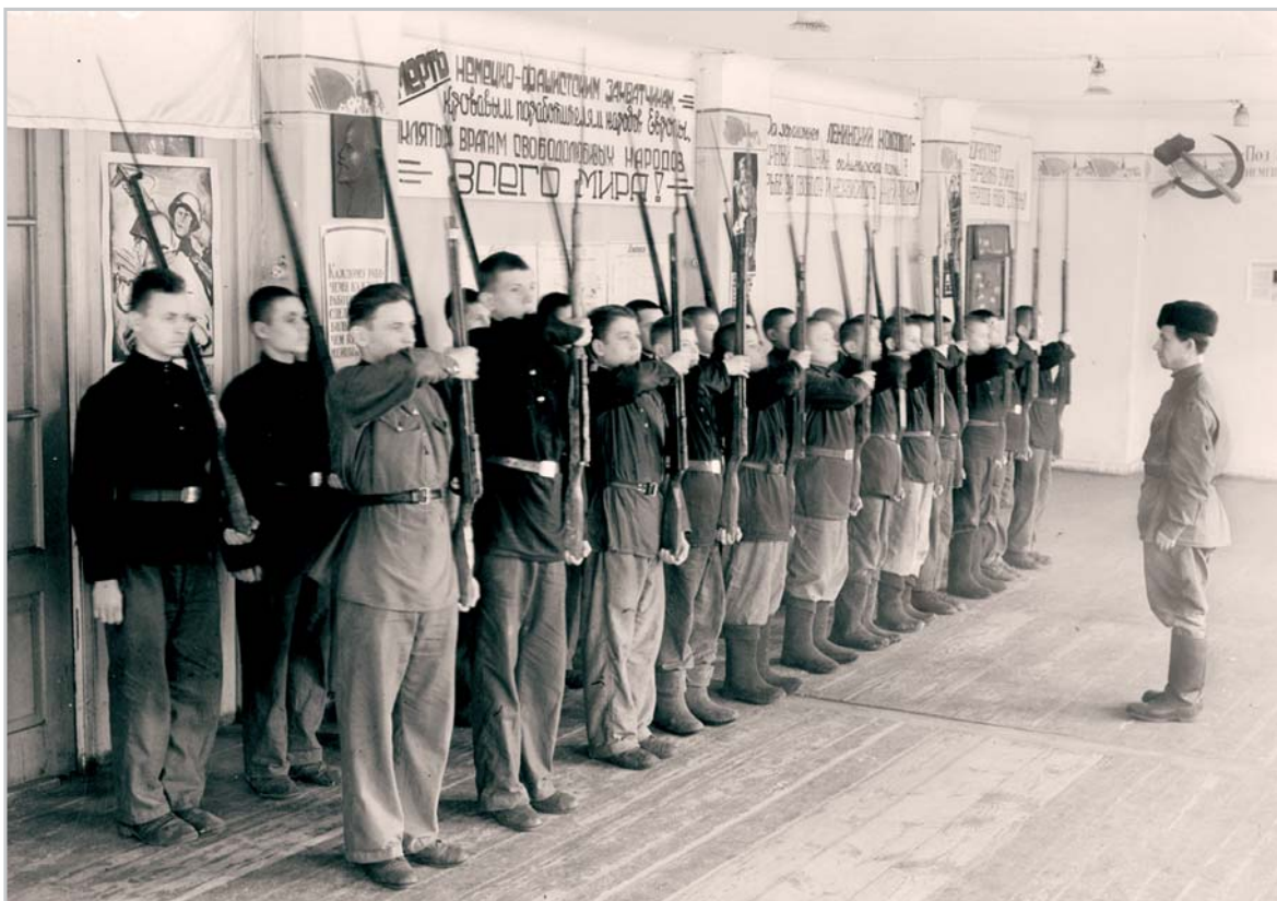
Урок военной подготовки в одной из свердловских школ. 1943 г.