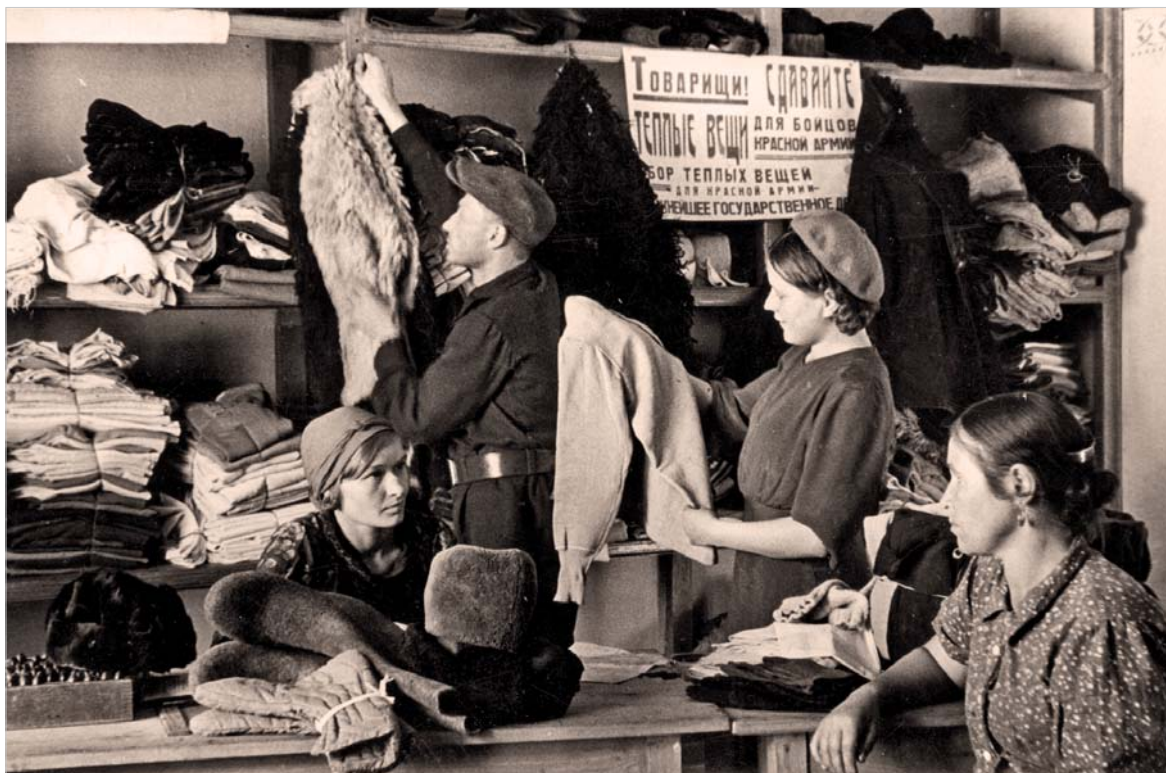
Сбор теплых вещей.