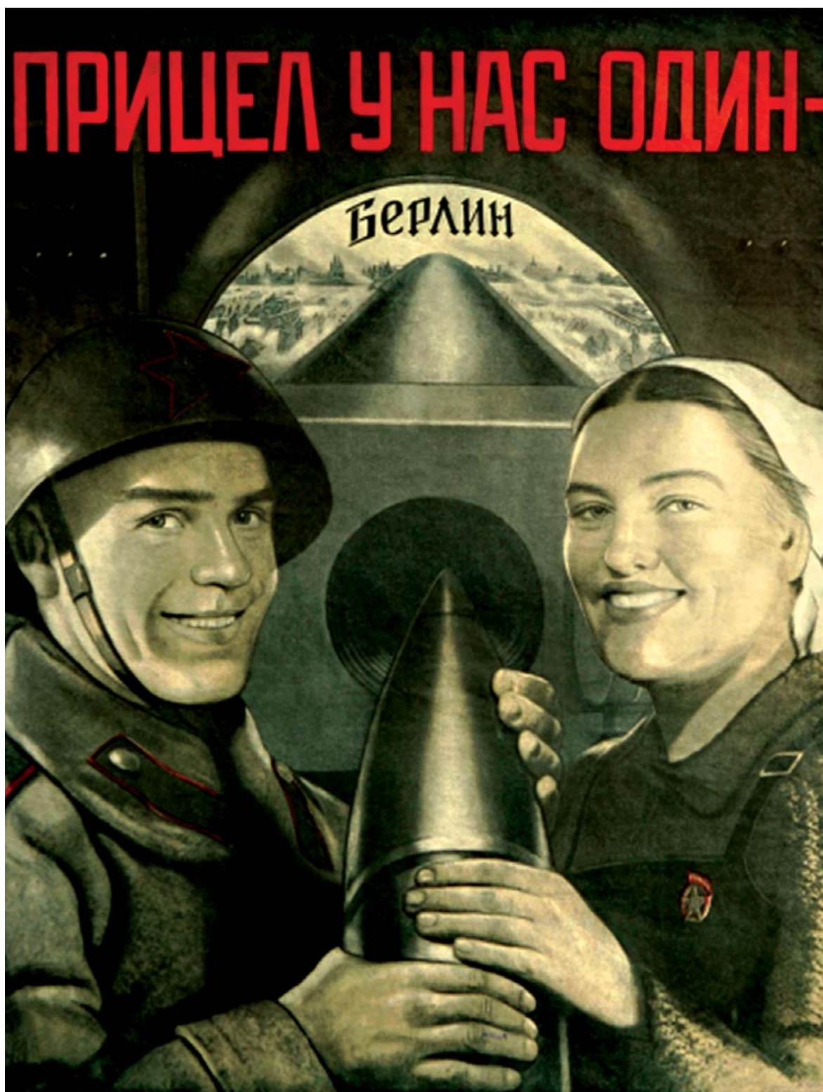
Советский политический плакат. Художник В. Б. Корецкий, 1945 г.