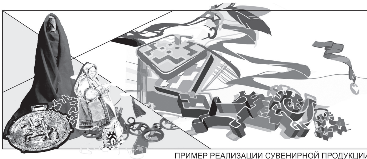
ПРИМЕР РЕАЛИЗАЦИИ СУВЕНИРНОЙ ПРОДУКЦИИ

культурных, природных аспектов, социально-экономических отношений, уровня развития техники и технологии к проектированию функциональных, экономических, эстетико-информационных, конструктивных, визуальных систем, имеющих множество связей и значений. Органичное соединение научно-творческой и практической деятельности, представленное в программе «Каменный пояс», способствует, с одной стороны, обнародованию и восполнению исторических данных и глубокому пониманию потенциала территории, с другой — переосмыслению ценности территории сквозь призму проектов в сфере системных научно-творческих дисциплин (архитектуры и дизайна, урбанистики и градостроительства).