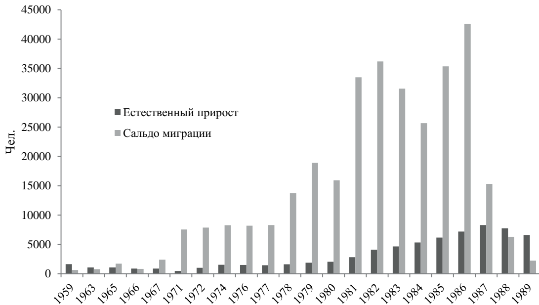
Рис. 3. Роль миграции и естественного прироста в формировании населения Ямала в 1959–1989 гг.