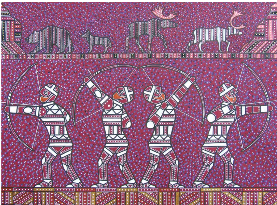
Павел Микушев. Серия работ к поэме К. Ф. Жакова «Биармия», 2010–2011 гг.