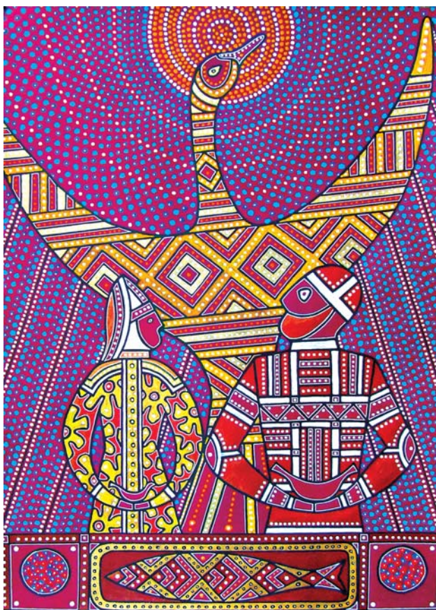
Павел Микушев. Серия работ к поэме К. Ф. Жакова «Биармия», 2010–2011 гг.