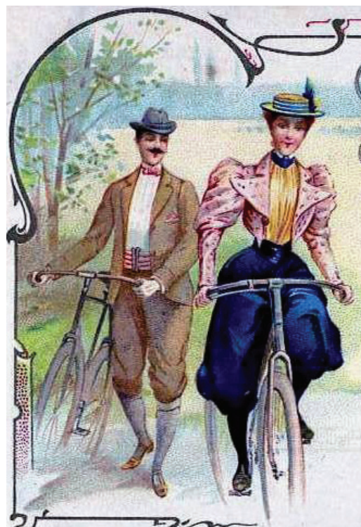
Открытки в стиле модерн. Начало XX в.