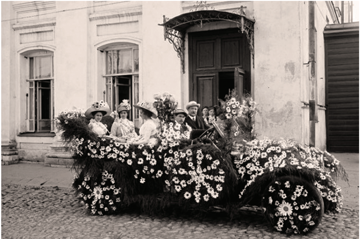
«День белой ромашки» — сбор пожертвований на борьбу с туберкулезом. Нижний Новгород, 1912 г.