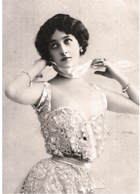
Фото-открытки звезд немого кино — Вера Холодная и Лина Кавальери. Рубеж XIX–XX вв. Документальный фонд Пермского краеведческого музея