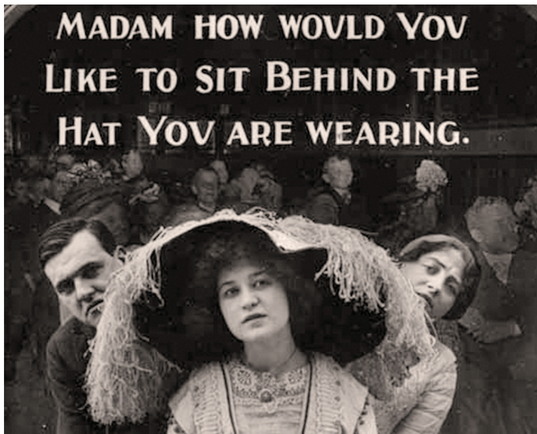
«Мадам! Не хотели бы вы сесть за шляпой, которую вы носите?» Афиша на ярмарочном никельодене (кинотеатре). Начало XX вв.