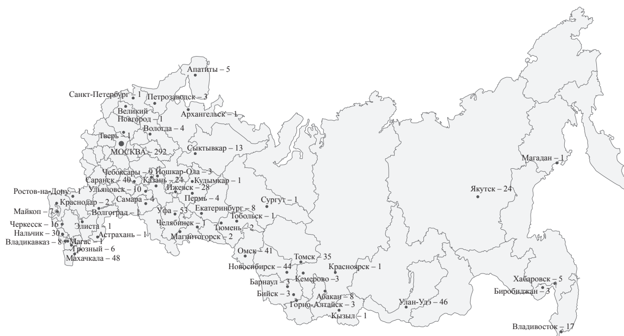
Количество подготовленных докторских и кандидатских диссертаций по специальности 07.00.07 по городам (1995–2019)

выступили исследователи по филологическим (18), философским (5), медицинским наукам (1) и культурологии (2). У 9 исследователей сформировались три типа социальных связей, еще у 32 — два. Ведущими организациями для диссертантов стали 33 научных центра, в том числе СПбГУ (40), РЭМ (23), ИЭА РАН (6).