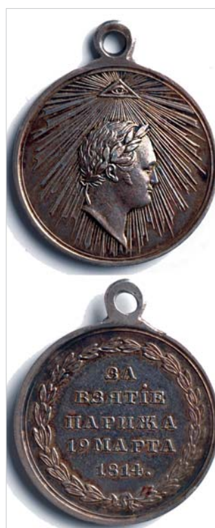
Медаль «За взятие Парижа». Серебро. Учреждена 30 августа 1814 г. Из частного собрания