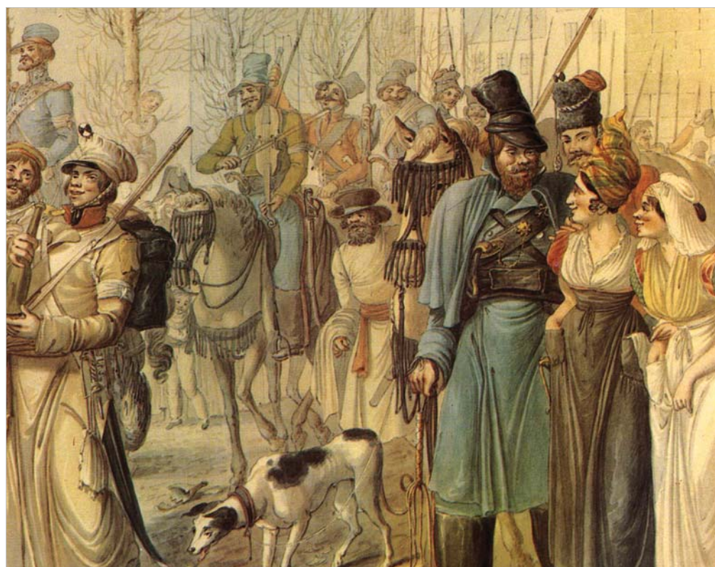
«Казачи проходят через город». Из серии акварельных рисунков Г. Э. Опича «Казачи в Париже в 1814 г.» Из частного собрания