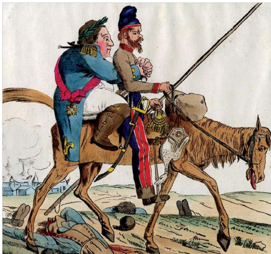
Казак, везущий в седле Людовика XVIII. Английская карикатура. Неизвестный автор, 1-я четверть XIX в.