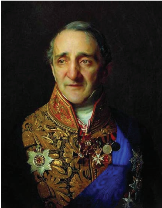
Портрет Христофора Екимовича Лазарева. С. К. Зарянко. Холст, масло. 1851 г.