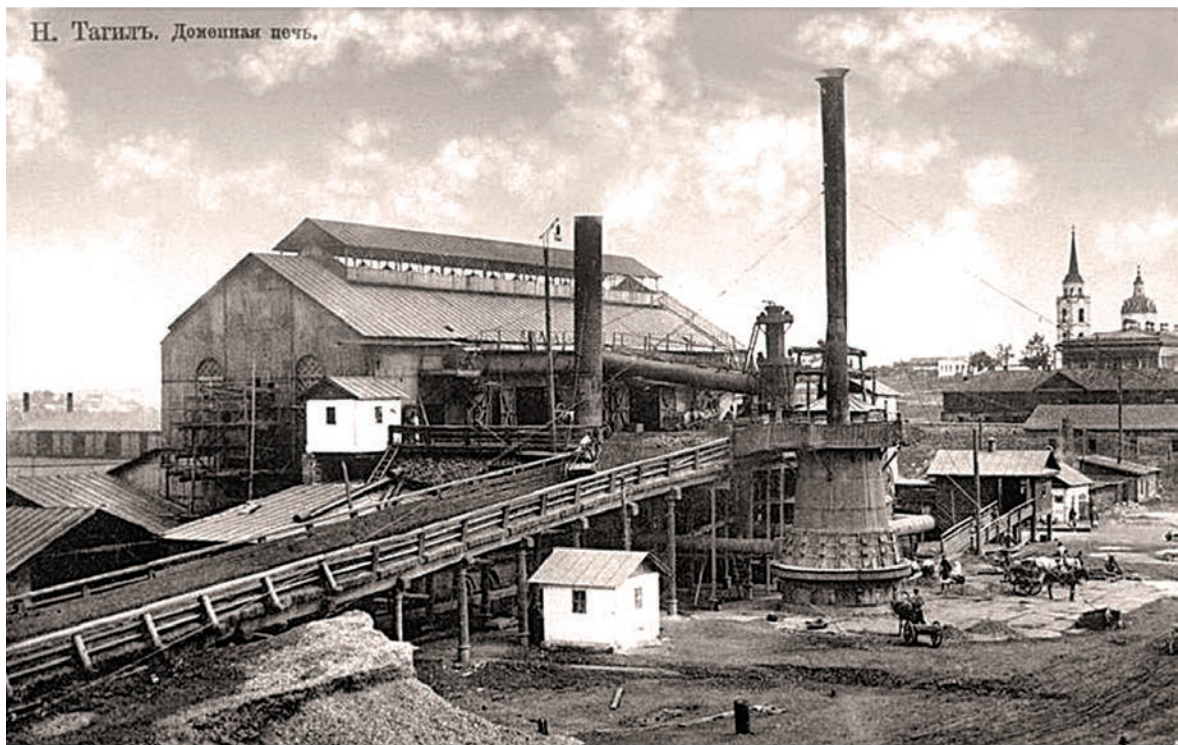
Н. Тагиль. Доменная печь.