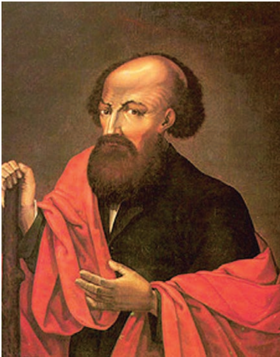
Портрет Никиты Демидовича Демидова. Неизвестный художник начала XVIII в.