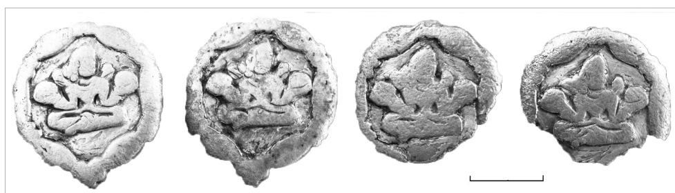
Рис. 2. Могильник Уелги. Накладки с буддийским сюжетом, серебро