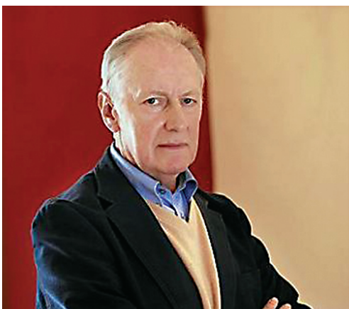
Петр Штомпка (1944 г. р.), один из создателей неомодернизационной теории