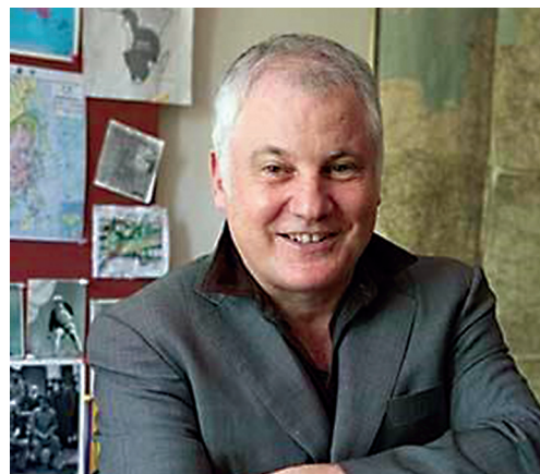
Стивен Коткин (1959 г. р.), разработчик концепции советского модерна