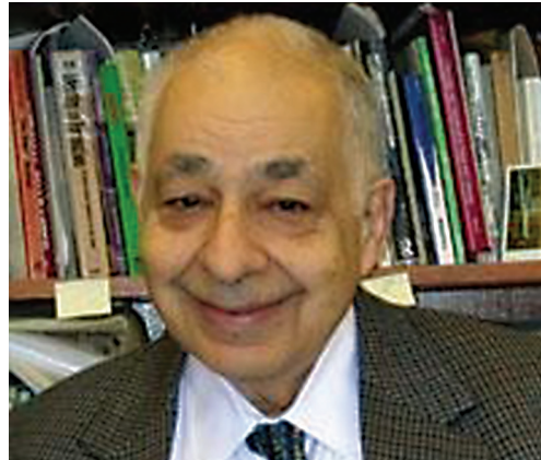
Эдвард Ашот Тириалян (1929 г. р.), один из создателей неомодернизационной теории