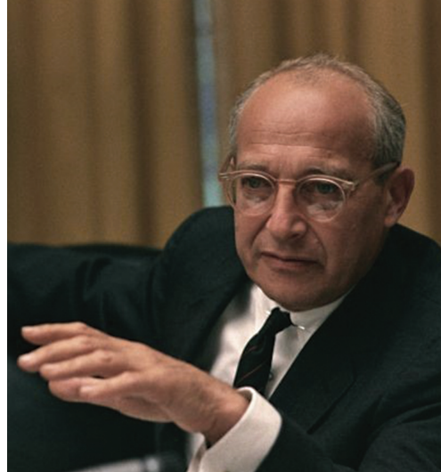
Уолт Уитмен Росту (1916–2003), создатель теории стадий экономического роста