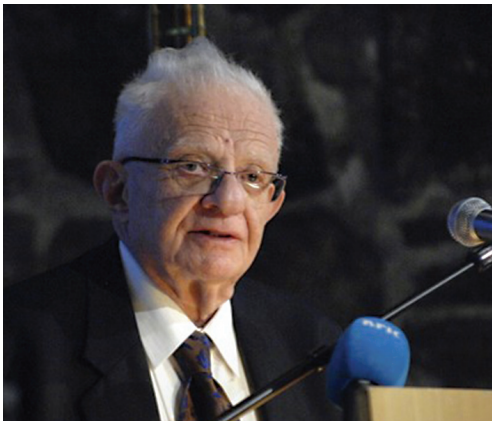
Шмуэль Ной Эйзенштадт (1923–2010), специалист в области сравнительных исследований и модернизации