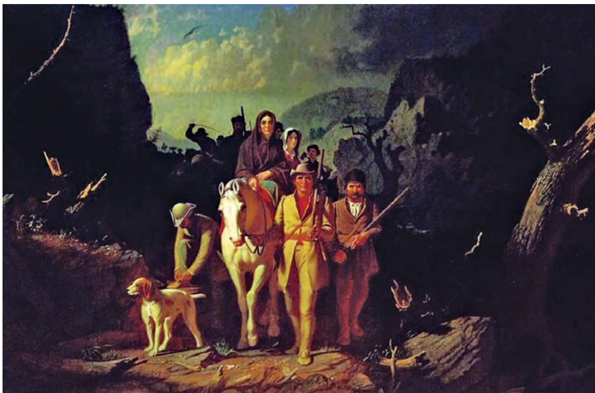
«Дэниел Бун ведет переселенцев через Камберлендский проход». Художник Дж. К. Бингхэм, 1851 г. Холст, масло