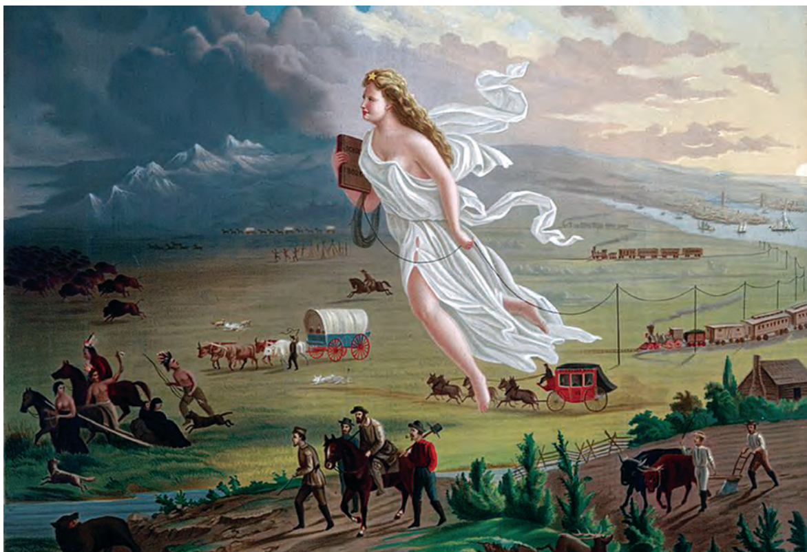
«Американский прогресс». Художник Дж. Гаст, 1872 г. Хромолитография.