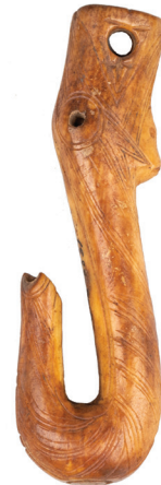
Рис. 1. Крюки из Эквенского могильника 1 — погребение № 10–11 (лицевая сторона и профиль); 2 — погребение № 143 (лицевая сторона и профиль); 3 — погребение № 100 (общий вид и следы использования); 4 — погребение № 154; 5 — погребение № 183