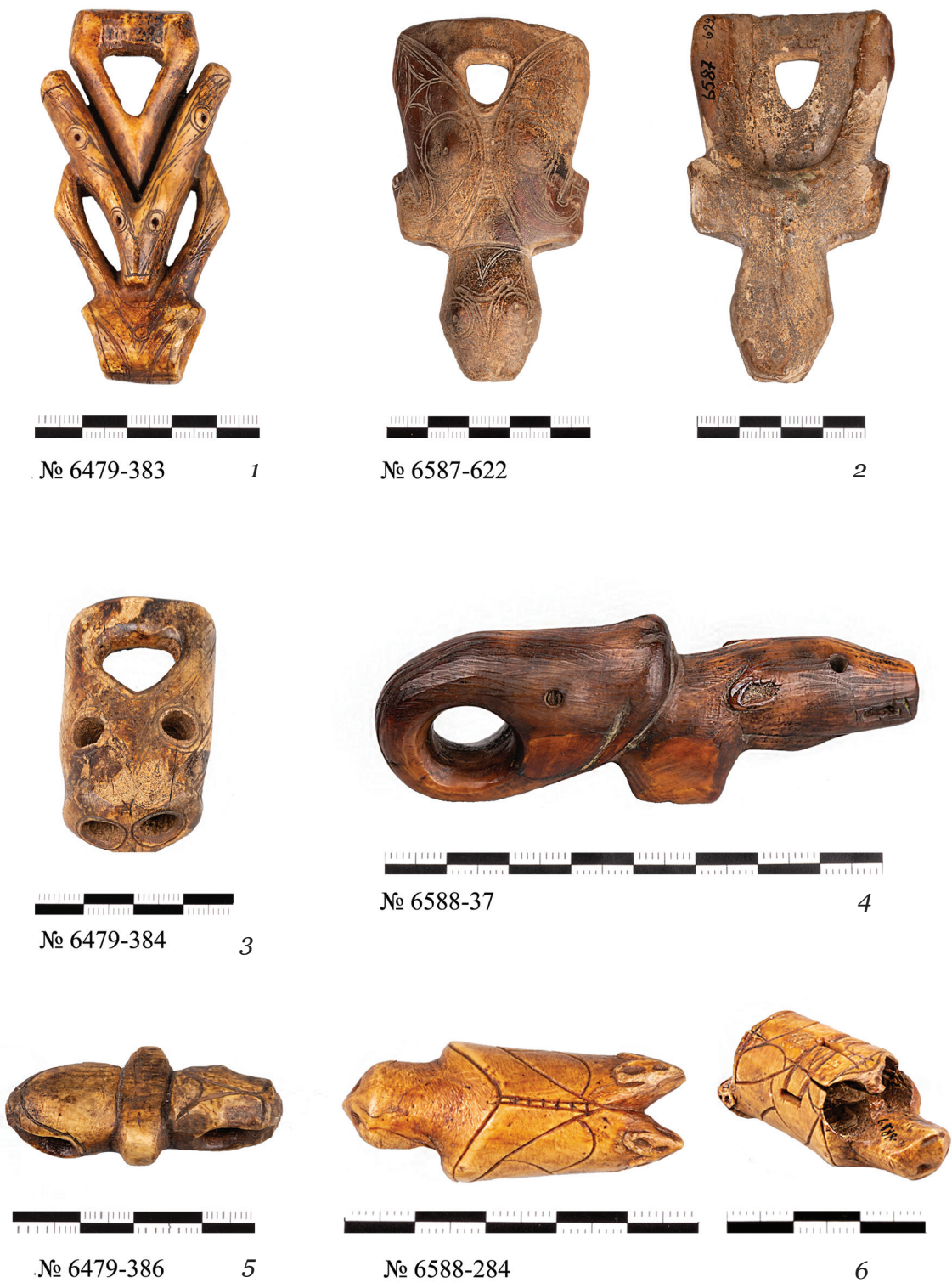
Рис. 2. Карабины из Эквенского могильника

1, 3, 5 – погребение № 10–11; 2 – погребение № 139 (лицевая и обратная сторона); 4 – погребение № 154; 6 – погребение № 155–156 (лицевая и обратная сторона)