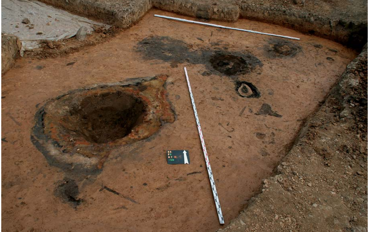
Колодцы 5/7–5/11. Зачистка на уровне верхнего заполнения объектов. Укрепленное поселение Каменный Амбар. Шестой раскоп. Челябинская обл., 2013 г.