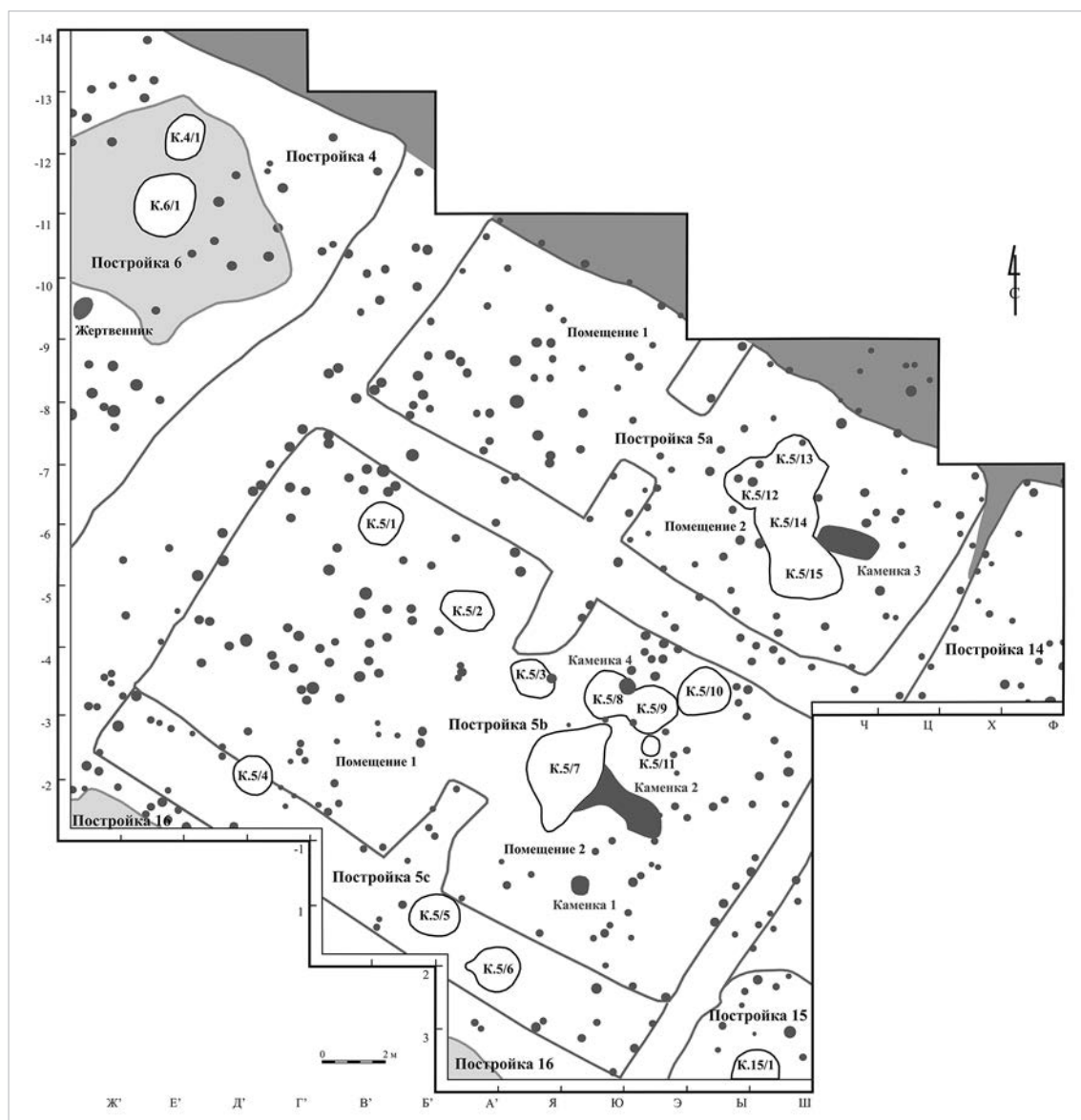
Рис. 1. Общий план расположения колодцев в раскопе 6

дневной поверхности составляла от 2,9 до 3,6 м, что соответствует водоносному песчаному слою речной террасы. Дно объектов зафиксировано в интервале -366-423 см от условного нуля. В процессе раскопок просачивание грунтовых вод начиналось с отметки -250-260 см. Исходя из предположения, что уровень грунтовых вод в древности был близок современному, мы можем констатировать, что нижняя часть колодцев была погружена в водоносный слой на 106-163 см.