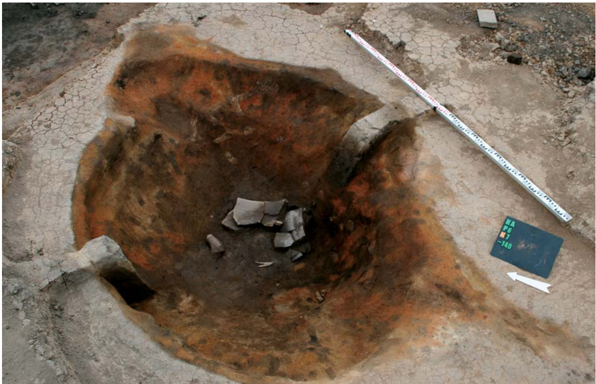
Яма-печь (горн) в верхнем заполнении колодца 5/7 с развалом срубно-алакульского сосуда. Укрепленное поселение Каменный Амбар. Шестой раскоп. Челябинская обл., 2013 г.