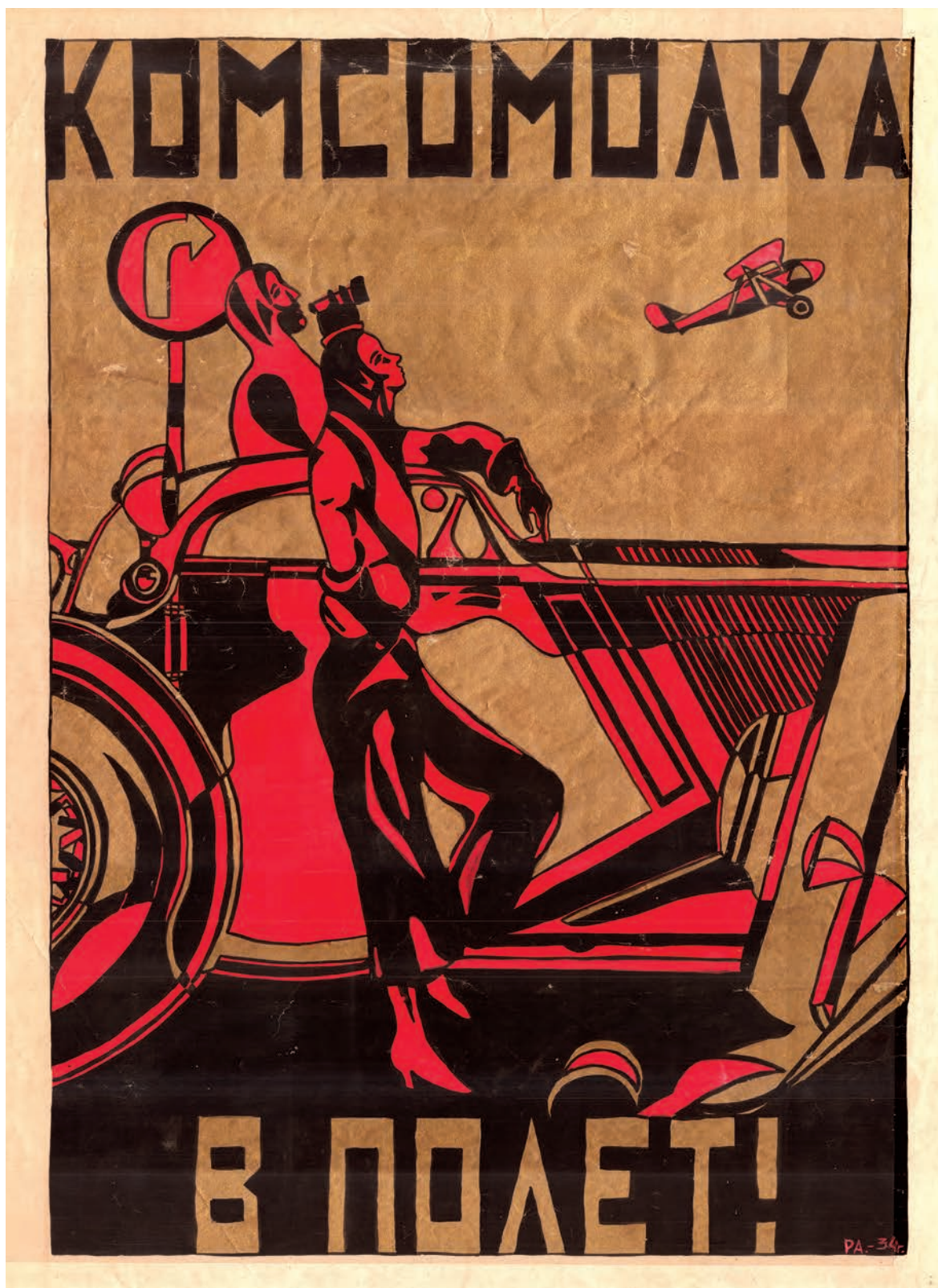
Плакат. Художник Р. Рабинович. 1934 г.