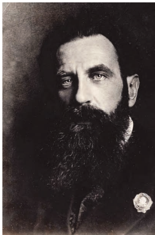
Герои Арктики Ведущий О. Ю. ШМИДТ Начальник экспедиции на Челюскине. № 2060

Открытки с фотографиями Героев Советского Союза и Героев Арктики. Год выпуска 1934. Цена 30 коп. Общий тираж 35.000 экз.