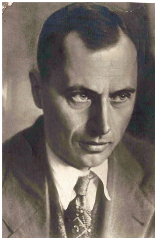
Герой Советского Союза М. П. Слепнев — летчик —