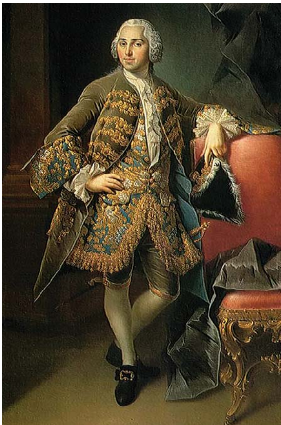
Никита Акинфиевич Демидов. Худ. Л. Токке. 1756–1758 гг. Нижнетагильский музей-заповедник