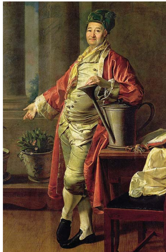
Прокофий Акинфиевич Демидов. Худ. Д. Г. Левицкий. 1773 г. Третьяковская галерея