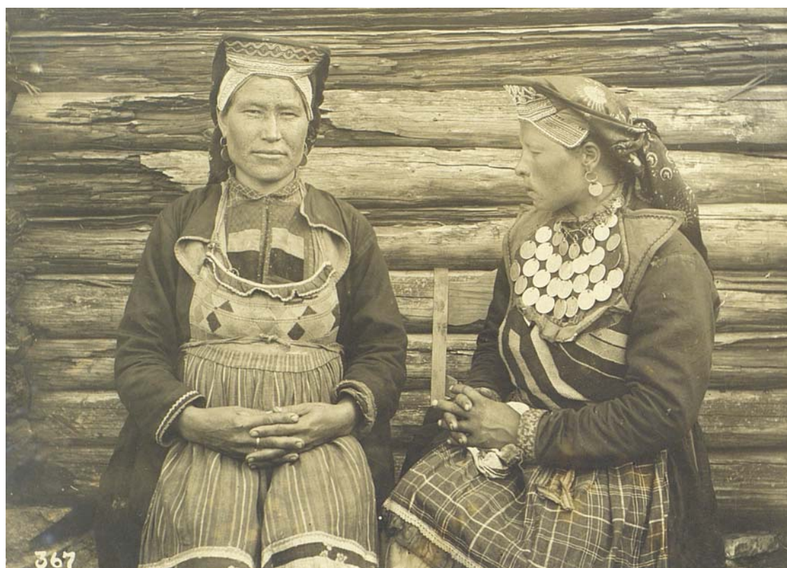
Групповой портрет — женщины в традиционных костюмах. Нагайбаки. Фото М. А. Круковского. Южный Урал. Начало XX в.

Музей антропологии и этнографии им. Петра Великого (Кунсткамера) РАН, № 1919-76, 84, 367