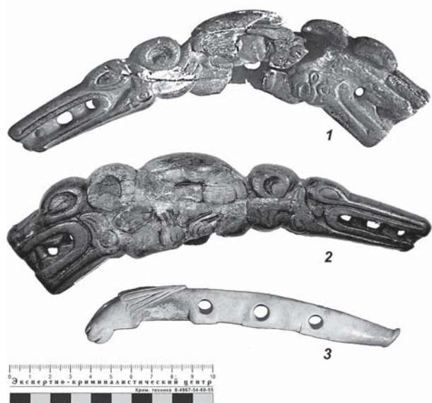
Рис. 1. Навершие из кургана № 2 у с. Варна: 1 — фотография из отчета археологической экспедиции В. С. Стоколоса, Варненский район, 1960 г.; 2 — фотография А. Д. Таирова, 2015 г.; 3 — псалий из кургана № 477 у с. Великие Будаки (фотография из электронного каталога Государственного Эрмитажа)

псалий, долгое время в статьях и монографиях, связанных с искусством раннего железного века, трактовался по-разному: как псалий, клык-подвеска или рог. В статье К. Ф. Смирнова 1976 г., посвященной савромато-сарматскому звериному стилю, автор относит изделие к группе кабаньих клыков-подвесок. 6 Позже Е. Ф. Королькова, анализируя звериный стиль Евразии, вслед за К. Ф. Смирновым повторяет данное определение. 7 На сегодняшний день в каталогах и учебниках, посвященных археологии Южного Урала, предмет, найденный при раскопках В. С. Стоколоса, фигурирует только как псалий. 8